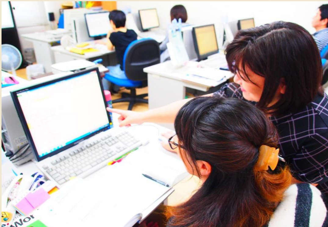
・この写真は株式会社コム(会津若松市)の訓練実施風景です