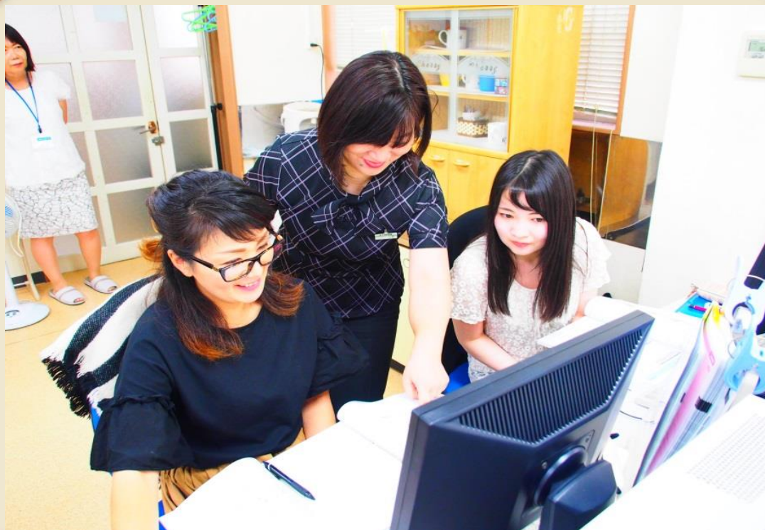
・この写真は株式会社コム(会津若松市)の訓練実施風景です