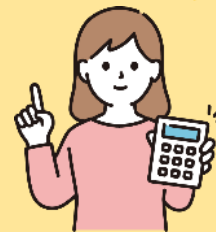
30代・女性 (R7年度訓練生)