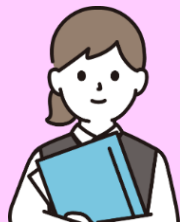
40代女性 (R7年度訓練生)

「何をすべきか、何がやりたいか」ではなく「何ができるか」という【強み】が明確化でき、 行動レベルに落とし込めたのが大きな成果だった。