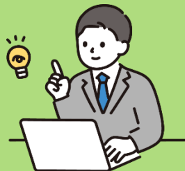
50代男性 (R7年度訓練生)